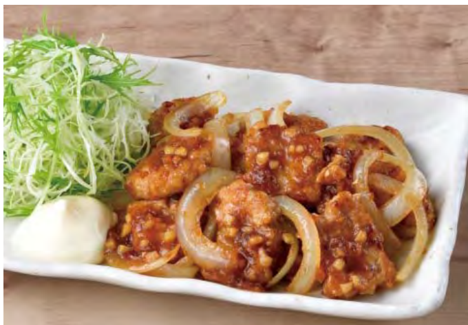
■ ～たっぷり生姜～ポークジンジャー 698 円（税込 768 円）