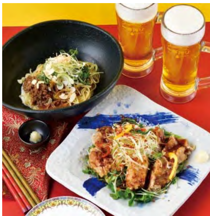
■ビールによく合う 大きな油淋鶏 998 円（税込 1,098 円）