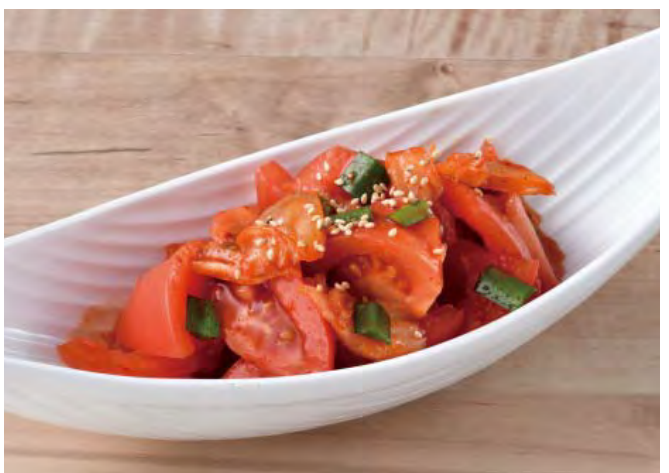
■ 韓流！旨辛トマトキムチ 298 円（税込 328 円）