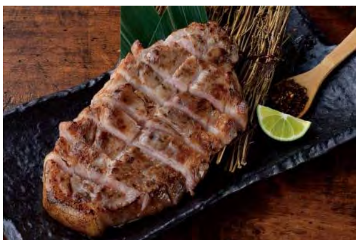
■厚切り豚肩ロースの炭火焼 998 円（税込 1,098 円）