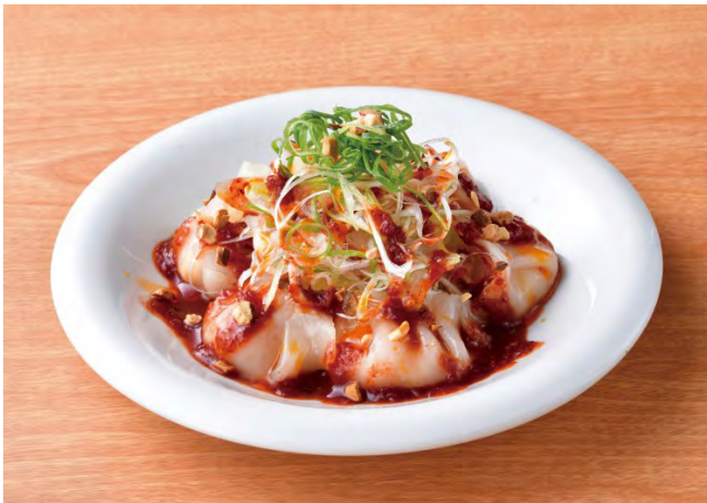
■プリプリ海老のピリ辛冷製水餃子 498円（税込548円）