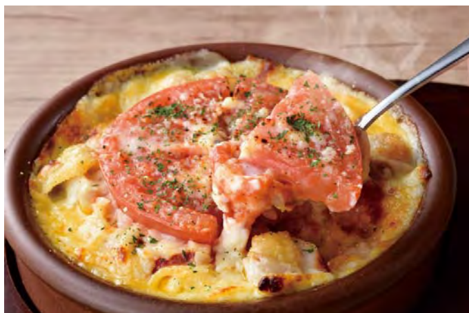
■ 熱々！トマトチキンドリア 598 円（税込 658 円）