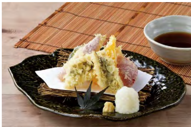
■穴子と夏野菜の天ぷら 598 円（税込 658 円）