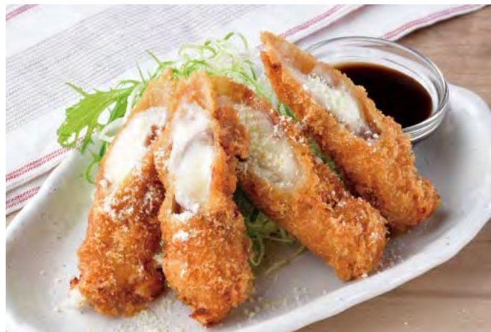
■ のび～るチーズの豚ロールカツ 398 円（税込 438 円）