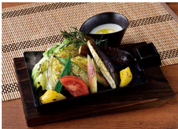
■夏野菜のグリル バーニヤカウダ仕立て 598 円（税込 658 円）