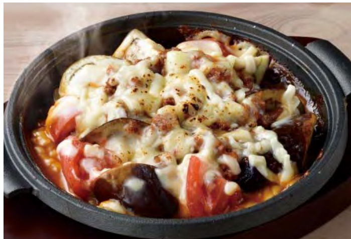
■ 茄子とトマトの肉味噌チーズ焼き 598 円 (税込 658 円)