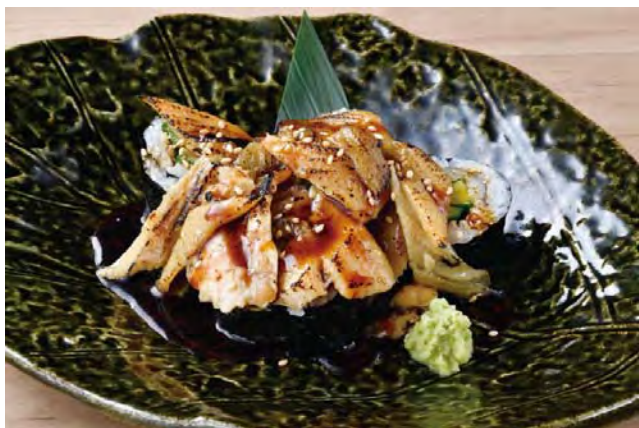
■炙り煮穴子こぼれ寿司 598 円（税込 658 円）