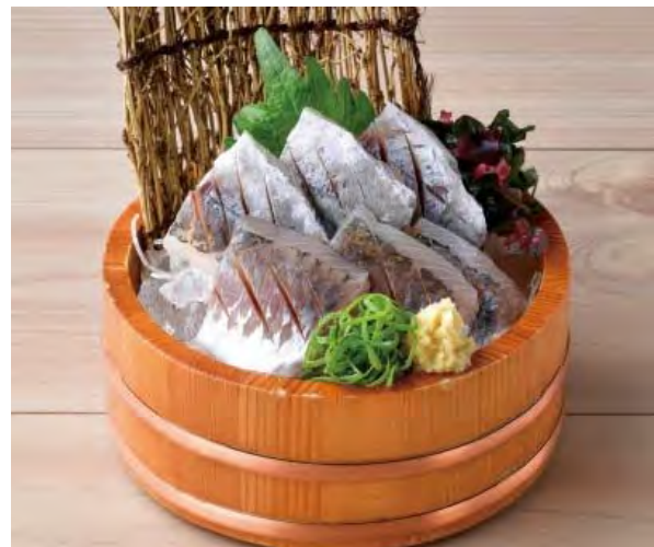
■ 真鱈の刺身 598 円 (税込 658 円) 上品な脂と旨味をご堪能ください。