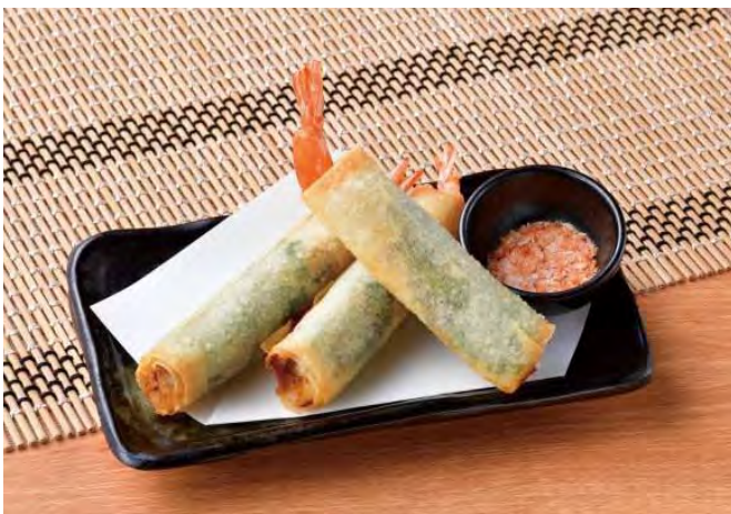
■店仕込み！海老と竹輪の紫蘇春巻き ～海老塩添え～ 498円（税込548円）