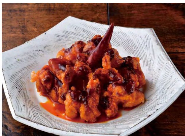
■ビールがすすむ 激辛！バリ辛ドリ® 498 円（税込 548 円）