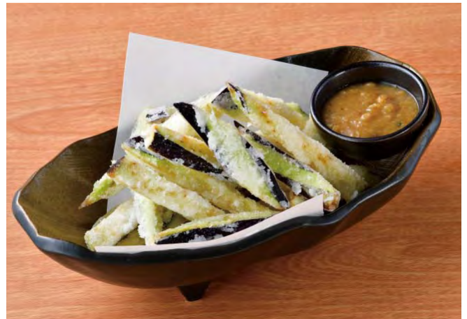
■とまらない！フライド茄子 298円（税込328円）