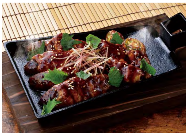
■茄子とおくらの肉巻きスタミナ鉄板焼 598 円（税込 658 円）