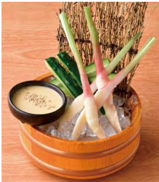
■ 葉生姜と胡瓜の味噌マヨ添え 398 円 (税込 438 円)