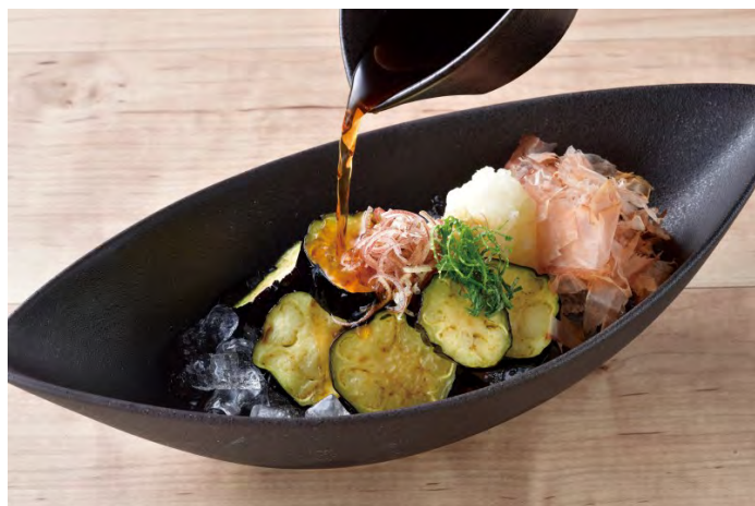
■冷たい茄子の揚げ出汁 ～かちわり氷仕立て～ 448 円（税込 493 円）