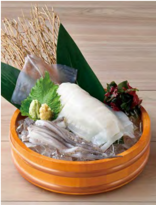
■ 佐賀県産 いか姿刺し 2,980 円 (税込 3,278 円)