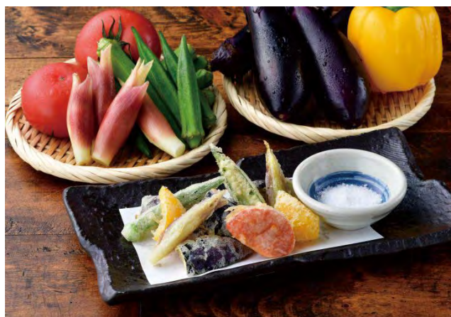
■夏野菜五種の彩り天ぷら 498 円（税込 548 円）