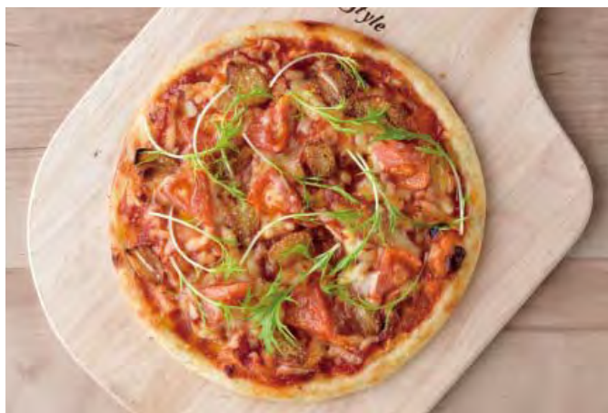
■ フレッシュトマトとガーリックのピザ 598 円（税込 658 円）