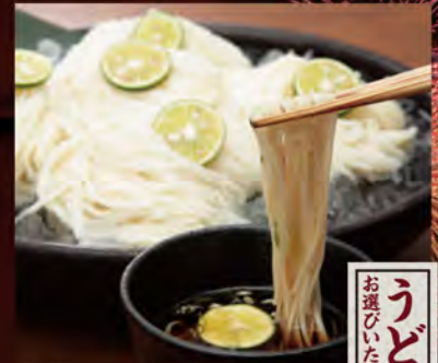
●冷え冷えすだち手延べそうめん