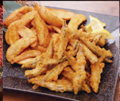
●阿久根産さびなごとカレーポテトフライ