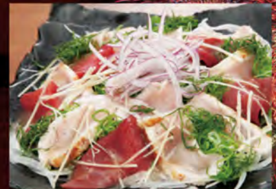
●地鶏むね叩きと馬刺しの香味カルパッチョ

夏野菜と完熟トマトの鶏ちゃん焼、地鶏を堪能 暑さをグールドウン出来るお得なコース!!