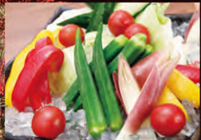
●季節のたっぷり新鮮野菜 ～特製なめ味噌添え～