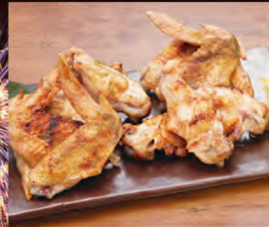
●地どりの手羽ゆず胡椒炭火炙り焼