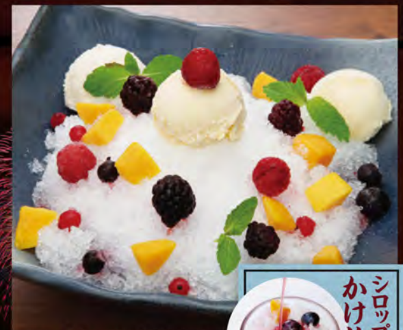
●農場式!! 氷しろくまアイス