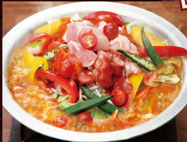
●夏野菜と完熟トマトの鶏ちゃん焼