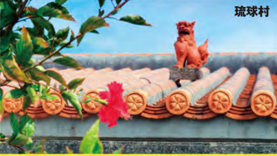
琉球村 古宇利大橋