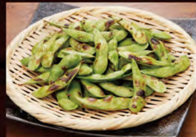
●炙り塩枝豆～こだわりの奄美さんご塩～