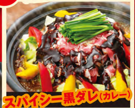
スパイシー黒ダレ(カレー)