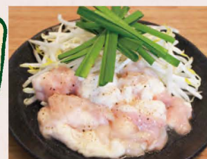
牛ホルモン塩炒め