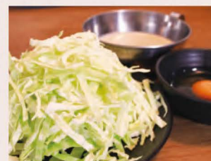
大阪名物キャベツ焼