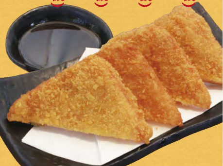
昔ながらのハムカツ