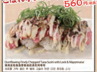
Overflowing Finely Chopped Tuna Sushi with Leek & Mayonnaise 高麗辣菜豆腐刺身 2品 3品 4品 5品 6品 7品 8品 9品